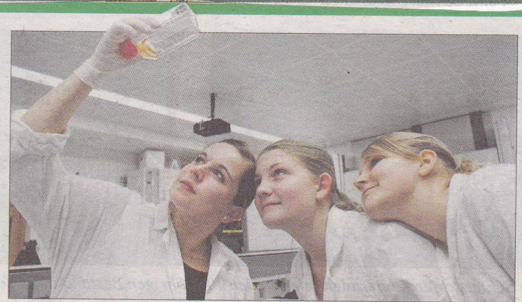
Im modernen Schullabor sind alle Tests möglich.

Neben der Arbeit im Labor war es den Schülern der HLFS Ursprung auch wichtig, sich mit